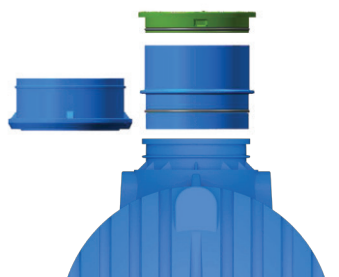
Erweiterung der Schächte mit Ringen oder mit Teleskop