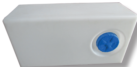
CARAVAN TRINKWASSER BEHÄLTER