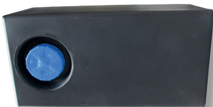
CARAVAN ABWASSER BEHÄLTER

Das Typenprogramm von Trinkwasser und Abwasser Behältern für Wohnwagen/Wohnanhänger habe wir wegen einer immer stärkeren Nachfrage für Behälter mit Standardmaßen, hochwertiger Herstellung und günstigen Preisen entwickelt.