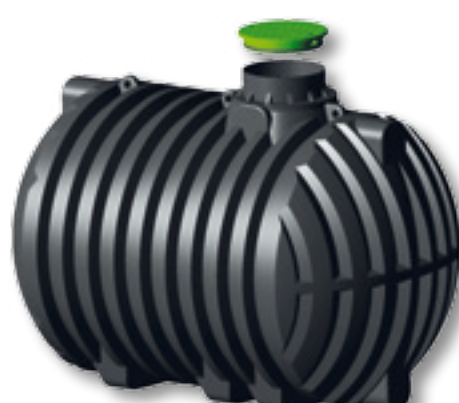
za odpadno vodo