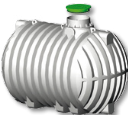
za pitno vodo (certifikat W 270)